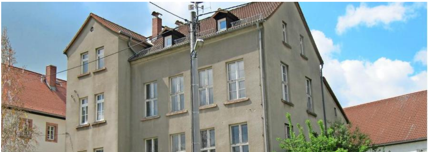
Die alte Jahnshainer Schule soll aus dem Dornröschenschlaf geweckt und zum Haus mit verschiedenen Nutzungen werden.

| Artikel veröffentlicht: 01. Juni 2017 18:29 Uhr | Artikel aktualisiert: 04. Juni 2017 00:18 Uhr