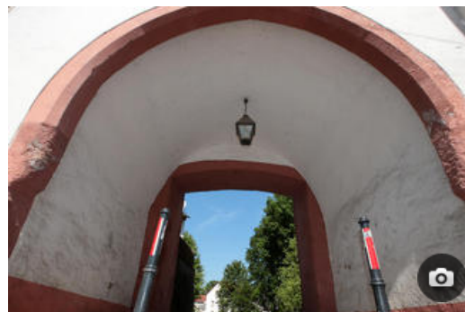
Ein Spaziergang durch die Region Geithain